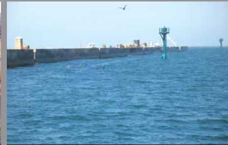
Rompeolas Sempra Energy, México