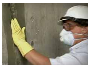
Taponeado Patch'n Plug