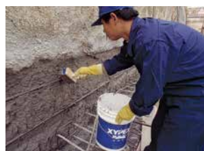
Recubrimiento Concentrado & Modificado

Los sistemas de recubrimiento y productos de reparación Xypex permiten que dueños, ingenieros y contratistas puedan rehabilitar, de manera económica y confiada, estructuras que estén dañadas debido a los efectos del ataque de cloruros, carbonatación, reacciones álcali-agregados o sufran de deterioro en la superficie ocasionado por abrasión y ciclos de congelación y descongelación. Xypex Concentrado y Xypex Modificado se aplican como recubrimientos en forma de lechada a la superficie del concreto. Los productos Xypex (a diferencia de otros productos que necesitan aplicarse a un sustrato seco) necesitan de una superficie húmeda para ser aplicados – una condición típica de estructuras marinas. Este tipo de condiciones del ambiente no sólo son favorables, sino conductivas para que se lleve a cabo el proceso de Xypex por Cristalización. Los productos Xypex Patch'n Plug, Concentrado en Dry-Pac y Megamix están especialmente diseñados para reparar defectos del concreto permanentemente, tales como nidos/hormigueros, grietas estáticas y fallas en juntas frías y constructivas. Xypex Megamix logra devolver la integridad estructural a concretos severamente dañados, mientras proporciona las mismas propiedades de protección del concreto tratado con Xypex.