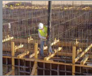
Concreto vertido en sitio