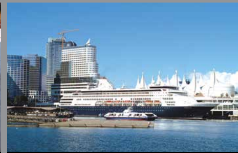
Muelle Flotante SeaBus, Vancouver, Canadá

Localice un distribuidor Xypex en su país: