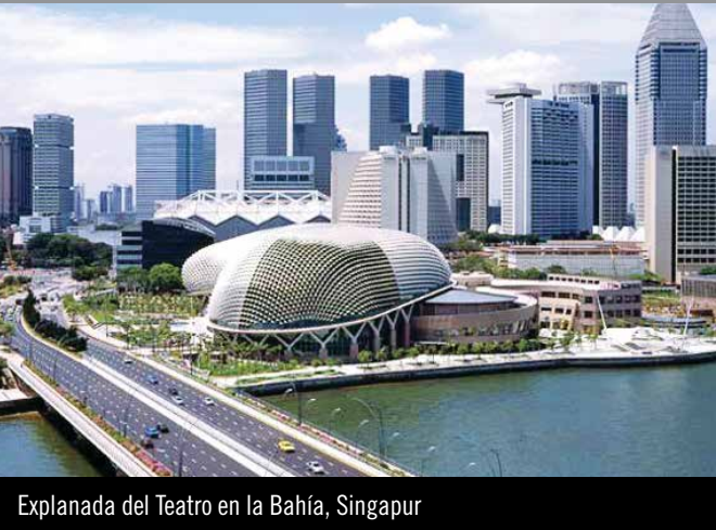
Explanada del Teatro en la Bahía, Singapur