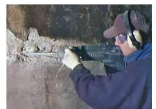
Rehabilitación Patch'n Plug & Megamix