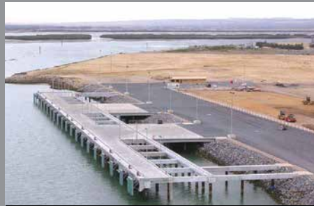
Muelle 8, Puerto de Adelaida, Australia