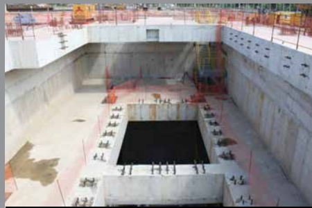
Superpuerto del Sudeste, Brasil