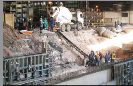
Daimler Chrysler, Sudáfrica