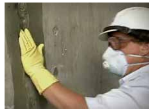
Taponeado Patch'n Plug