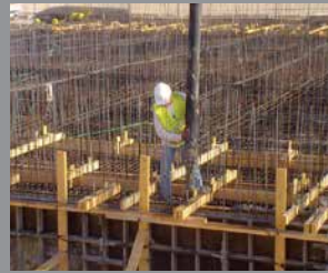
Concreto vertido en sitio