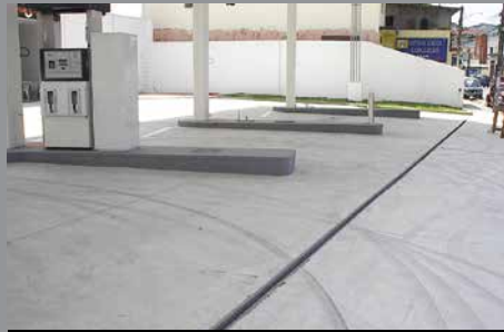
Estación de Gasolina Repsol, Brasil