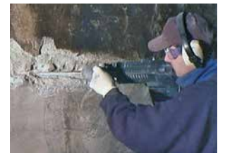
Rehabilitación Patch'n Plug & Megamix