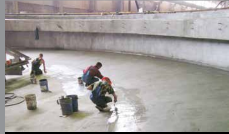
Tanque Salino Solikamsk (Planta Química), Rusia