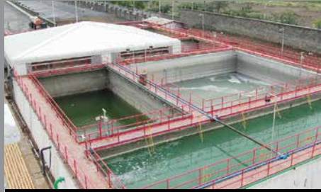
Planta de Tratamiento y Drenaje de Efluentes, Automotriz Fiat India