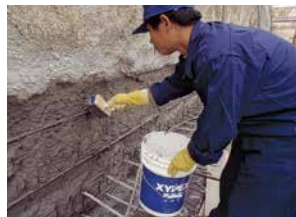
Recubrimiento Concentrado & Modificado

Los sistemas de recubrimiento y productos de reparación Xypex permiten que dueños, ingenieros y contratistas puedan rehabilitar, de manera económica y confiada, estructuras que estén dañadas debido a los efectos del paso de agua por presión hidrostática, ataque de cloruros, sulfatos, reacciones álcali-agregados o exposición a químicos agresivos. Xypex Concentrado y Xypex Modificado se aplican como recubrimientos en forma de lechada a la superficie del concreto. Los productos Xypex (a diferencia de otros productos que necesitan aplicarse a un sustrato seco) necesitan de una superficie húmeda para ser aplicados. Este tipo de condiciones del ambiente no sólo son favorables, sino conductivas para que se lleve a cabo el proceso de Xypex por Cristalización. Los productos Xypex Patch'n Plug, Concentrado en Dry-Pac y Megamix están especialmente diseñados para reparar permanentemente defectos del concreto, tales como grietas estáticas y fallas en juntas frías y constructivas. Xypex Megamix logra devolver la integridad estructural a concretos severamente dañados, mientras proporciona las mismas propiedades de protección del concreto tratado con Xypex.