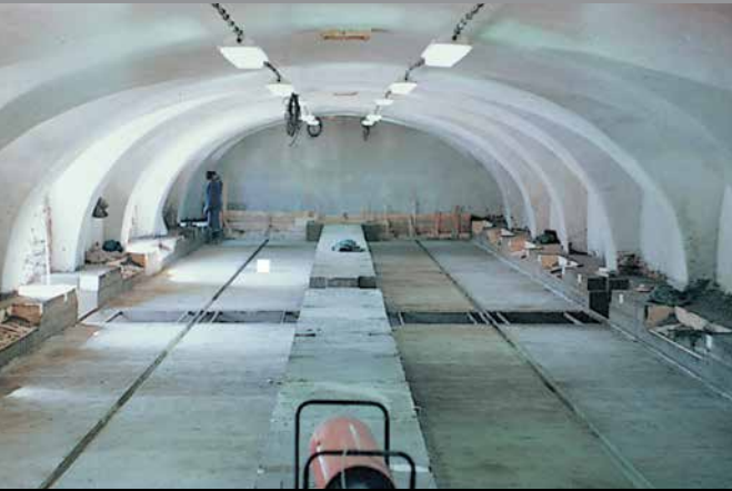
Granero Podlesice, Rep. Checa