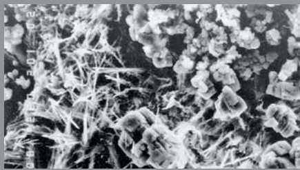
INICIO DE CRISTALIZACIÓN